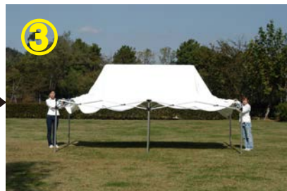
③ フレームを完全に開き 天幕を更に被せる