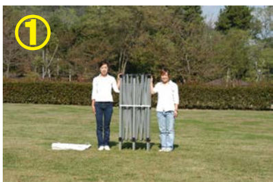
① フレームと天幕を用意