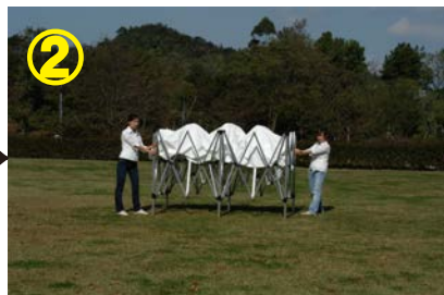
② フレームを少し広げ 天幕を被せる